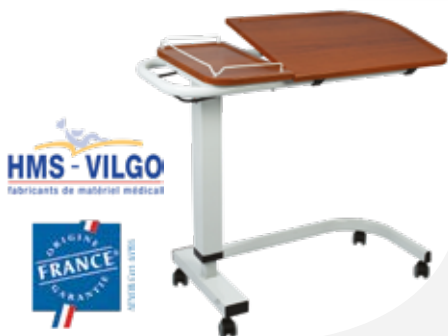
Table de lit double à vérin Kalisto

Table double plateau réglable en hauteur par vérin à gaz de 78 à 101 cm. Grand plateau inclinable équipé d'une galerie de rétention. Piétement en U avec 2 roulettes à freins. 15 coloris de tube et 2 de plateaux.